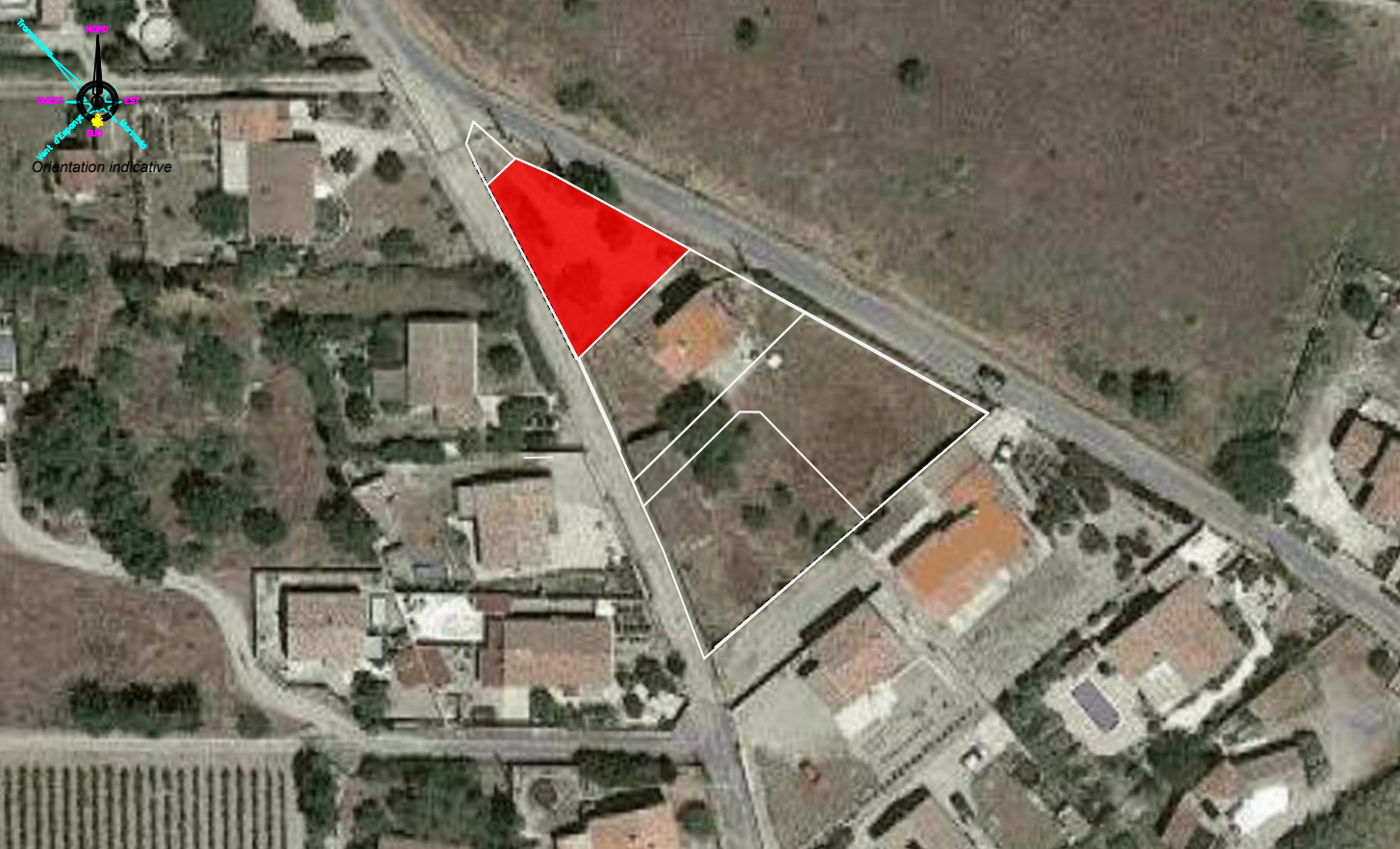
Plan de situation du lot ( 1/1000 )

Les coordonnées sont rattachées au système RGF93 CC43. Les altitudes sont rattachées au N.G.F. ( nivellement général de la France ). Les coordonnées XYZ sont calculées par le réseau national GNSS TERIA.