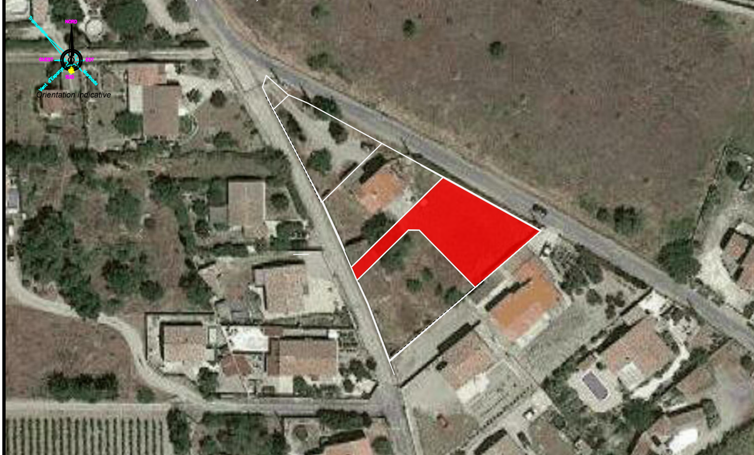
Plan de situation du lot ( 1/1000 )

Les coordonnées sont rattachées au système RGF93 CC43. Les altitudes sont rattachées au N.G.F. ( nivellement général de la France ). Les coordonnées XYZ sont calculées par le réseau national GNSS TERIA.