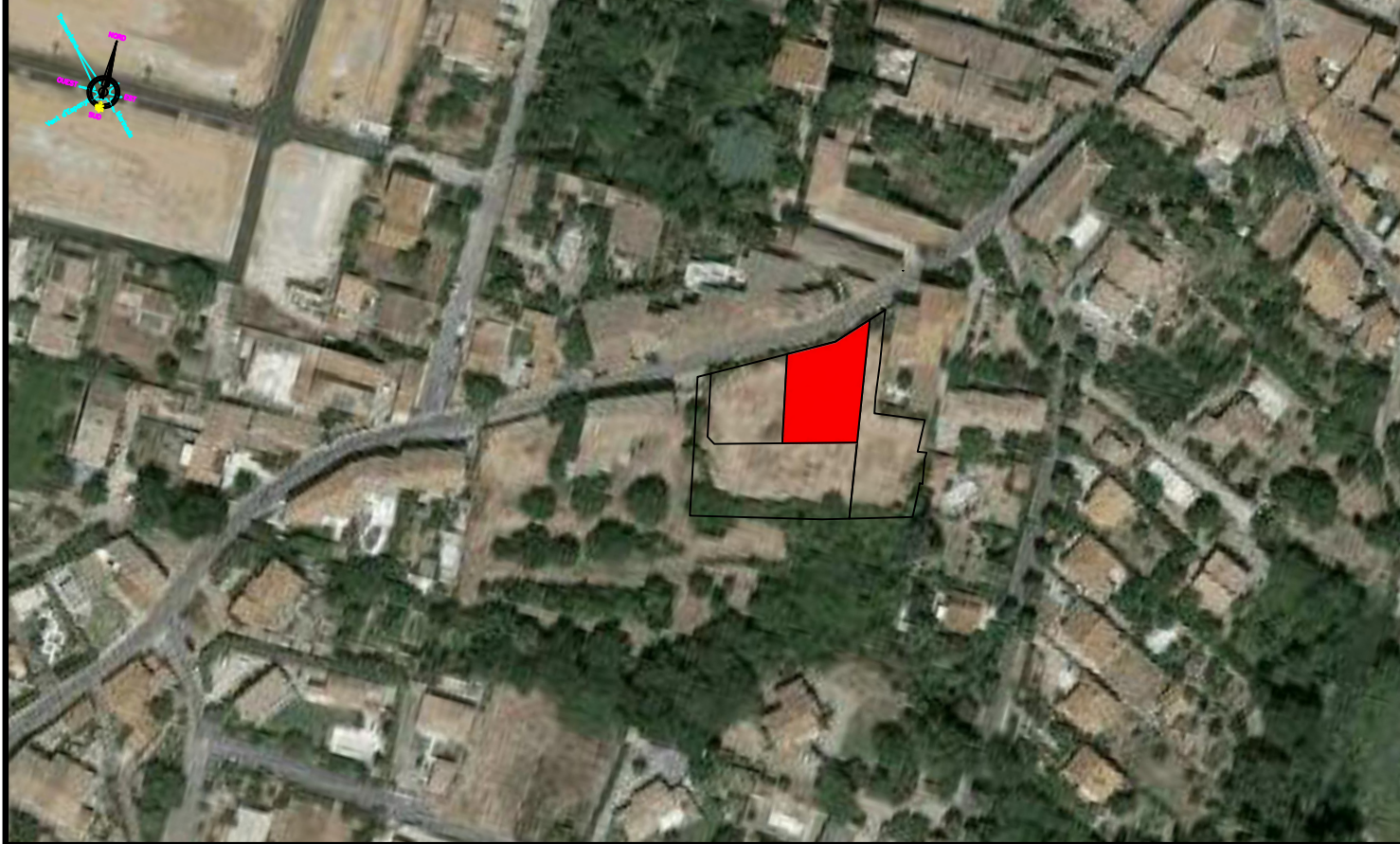
Plan de situation du lot ( 1/2000 )

Les coordonnées sont rattachées au système RGF93 CC43. Les altitudes sont rattachées au N.G.F. ( nivellement général de la France ). Les coordonnées XYZ sont calculées par le réseau national GNSS TERIA.