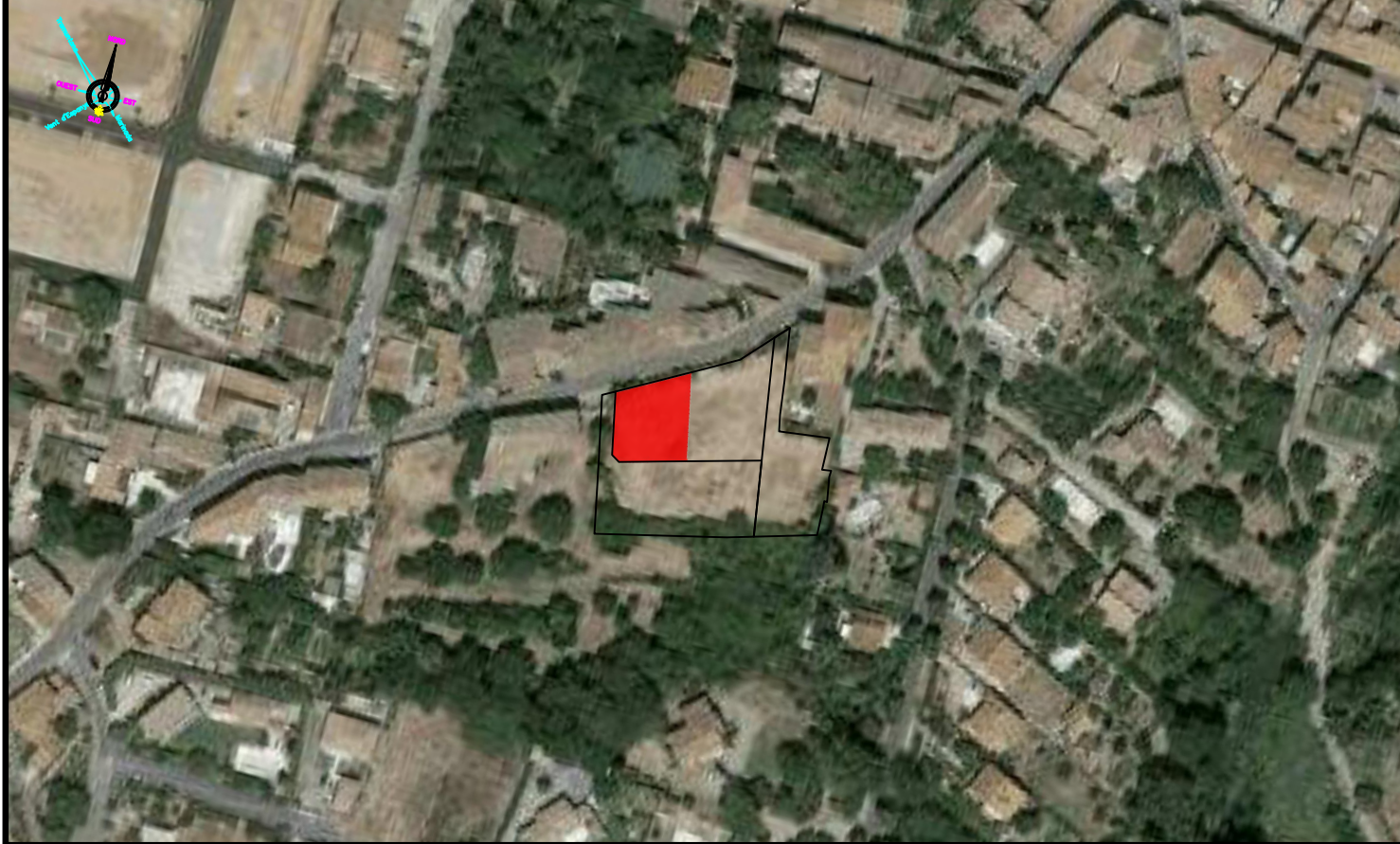
Plan de situation du lot ( 1/2000 )

Les coordonnées sont rattachées au système RGF93 CC43. Les altitudes sont rattachées au N.G.F. ( nivellement général de la France ). Les coordonnées XYZ sont calculées par le réseau national GNSS TERIA.